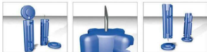
Коробка 100 штук

Сменные одноразовые ланцеты для автопрокалывателя, изготовлены из высококачественной хирургической стали. Стерильные, стандартные, с трехгранной копьевидной заточкой. Применяются с большинством многоразовых устройств для взятия капиллярной крови (автопрокалывателей).